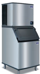
IT0900N con recipiente D-570