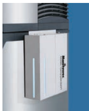
iAuCS (instalación externa)

Olvídese del mantenimiento habitual. El sistema iAuCS cuenta el número de ciclos de producción de hielo y, en función de la frecuencia que se seleccione, inicia un ciclo de limpieza AUTOMÁTICA. Elija entre intervalos de 4 a 24 semanas. Para las máquinas modulares de la serie Indigo NXT.