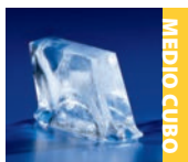
Máquina de hielo IB sobre un dispensador de bebidas

La serie IB de Indigo NXT® alberga la máquina de producción de hielo más pequeña 22 pulg. (56 cm) del sector. Al tener una profundidad de solo 36 cm, los operarios tienen un acceso más fácil al dispensador de bebidas y pueden limpiarlo, higienizarlo y darle mantenimiento sin problemas. Esta exclusiva característica se basa en la tecnología patentada CVD de Manitowoc® Ice, que posibilita un diseño compacto que consigue que la máquina de hielo funcione prácticamente sin hacer ruido y sin producir calor. Con un adaptador determinado, podrá instalar los modelos de la serie IB en casi cualquier dispensador de bebidas. De este modo, Manitowoc® Ice también se asegura de que siempre tenga hielo.