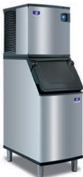
IT0420 con recipiente D-320