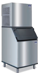
RFF1220C Con recipiente D-420