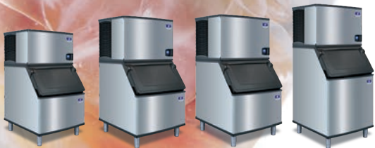
IT0300 con recipiente D-400