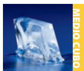
Disponibile en todos los modelos para debajo del mostrador

Estas compactas máquinas de hielo son perfectas para la producción de pequeñas cantidades de hielo, para usos limitados o como refuerzo de máquinas más grandes. Diseñadas específicamente para integrarse debajo de un mostrador o en cualquier otro espacio en el que no quepan máquinas más grandes. Dado su reducido tamaño, cualquiera de estos modelos es perfecto para cafeterías pequeñas, puestos en estadios, zonas de receso y/o para cualquier otra instalación que necesite poco hielo, así como un equipo pequeño.