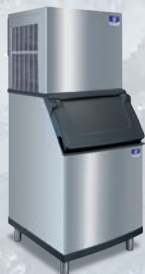
RFF1300 Con recipiente D-570