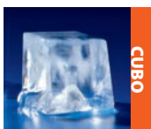
Disponibile en todos los modelos para debajo del mostrador