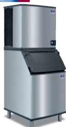
IT1200 con recipiente D-570