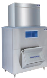
RFF2200C Con recipiente LB1760