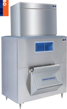
ST3000WH Con recipiente LB1760