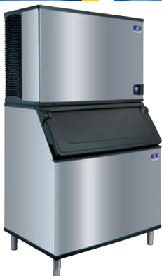
IT1900 Con recipiente D-970