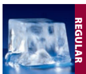
Disponibile en UF0140 y UF0310