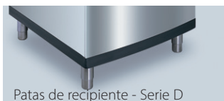
Patas de recipiente - Serie D

Esta capa de aleación de aluminio impide que se queden marcadas las huellas, tiene una mejor apariencia y dura más que el acero inoxidable 304.