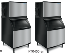
KT0400 en K400 con recipiente