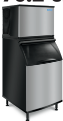
KT0500 en K570 con recipiente