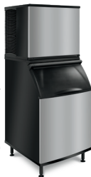
KT1000 en K570 con recipiente